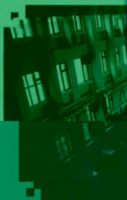
PLC 控制技术 训练场所